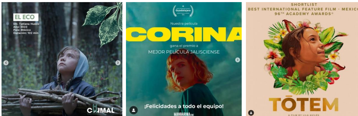
El eco (dir. Tatiana Huezo, 2023) | Corina (dir. Urzula Barba Hopfner, 2024) | Tótem (dir. Lila Avilés, 2023)

En el caso de jóvenes estudiantes de cine, comunicación, periodismo y animación, los festivales internacionales de cine son una oportunidad invaluable para visibilizar su trabajo, obtener retroalimentación y comenzar una carrera en la industria audiovisual. Nunca como ahora había sido tan fácil para cineastas jóvenes presentar sus trabajos en foros internacionales. La inmersión intensa requerida para rodar un cortometraje se puede movilizar no sólo para activar competencias profesionales valiosas, sino también para catapultar la proyección global de quienes inician sus carreras en el cine. Para ello sería conveniente establecer pequeños —pero decisivos— cambios de estrategia creativa desde preproducción y hasta la definición de la ruta de festivales .