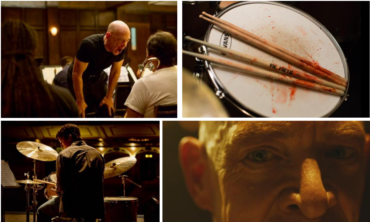
Whiplash (dir. Damien Chazelle, 2014) | imdb.com

Películas creadas con base en conceptos poderosos y sugerentes son Alien (dir. Ridley Scott, 1979), Corre, Lola, corre (dir. Tom Tywyker, 1998), Whiplash (dir. Demian Chazelle, 2013 y 2014), Roma (dir. Alfonso Cuarón, 2018), Una película de policías (dir. Alonso Ruizpalacios, 2021), Los ladrones: la verdadera historia del robo del siglo (dir. Matías Gueilburt, 2022) y Una jauría llamada Ernesto (dir. Everardo González, 2023).