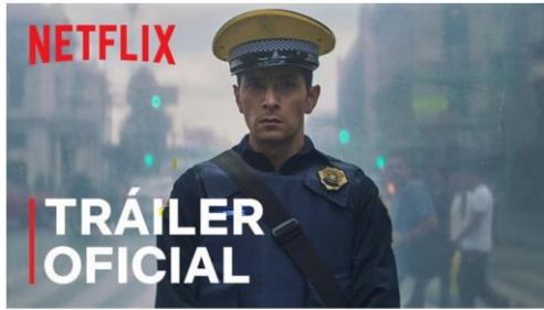
Una película de policías (Alonso Ruizpalacios, 2021)