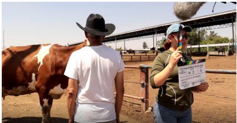
Aerodinámica de una vaca (dir. Emilia Hernández, 2024) | Selección 3er Festival Internacional de Cortometrajes del Tec de Monterrey